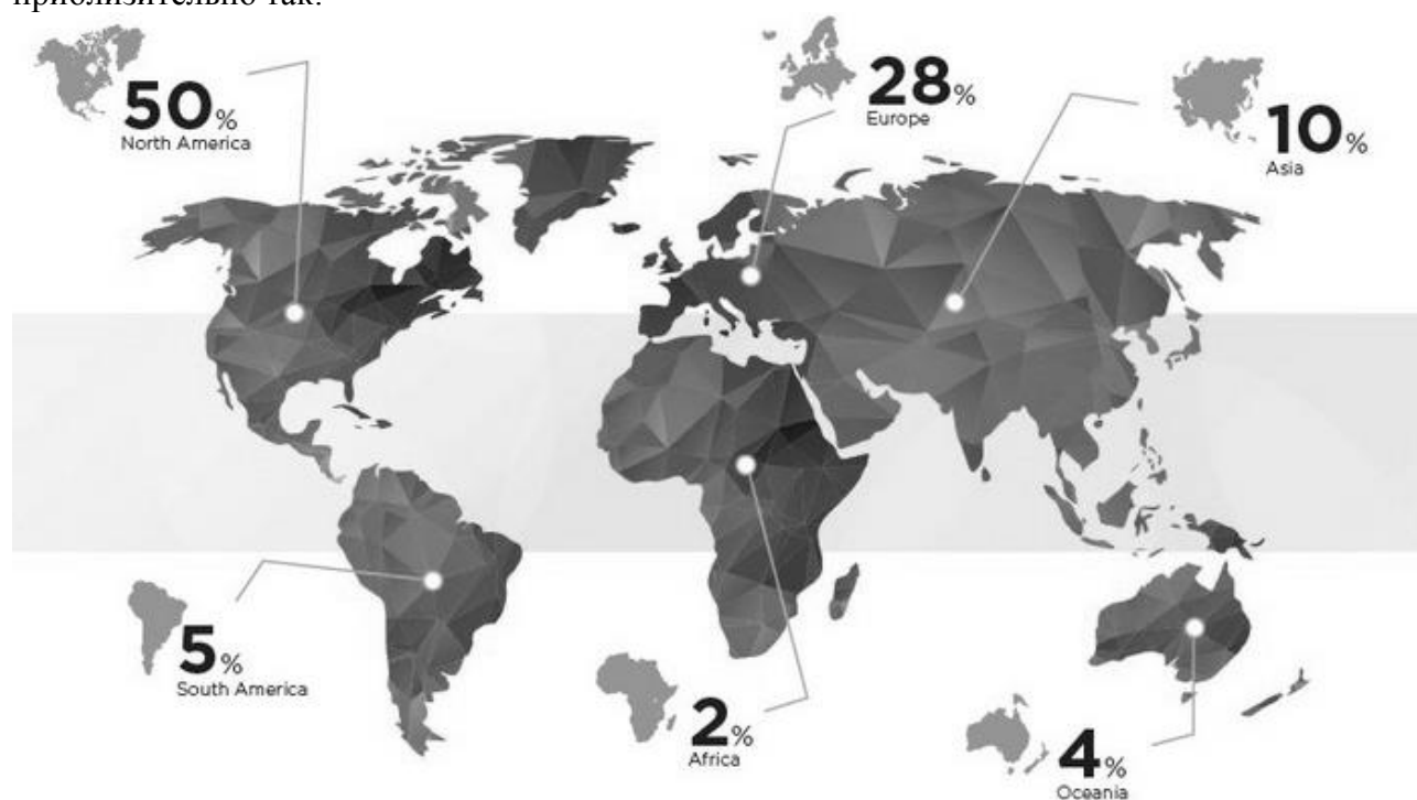
Рисунок 1 – Статистика применения методологии AGILE

Именно поэтому для повышения эффективности бизнеса необходимо внедрять на предприятиях гибкие системы управления. Выделяют процессный подход в управлении, примером такого процессного подхода является подход Agile. Популярность методологии открыла ряд возможностей для компаний по всему миру [8, 9]. Согласно мировому опросу статистического центра AGILE, распространение методологии по всему миру выглядит приблизительно так: