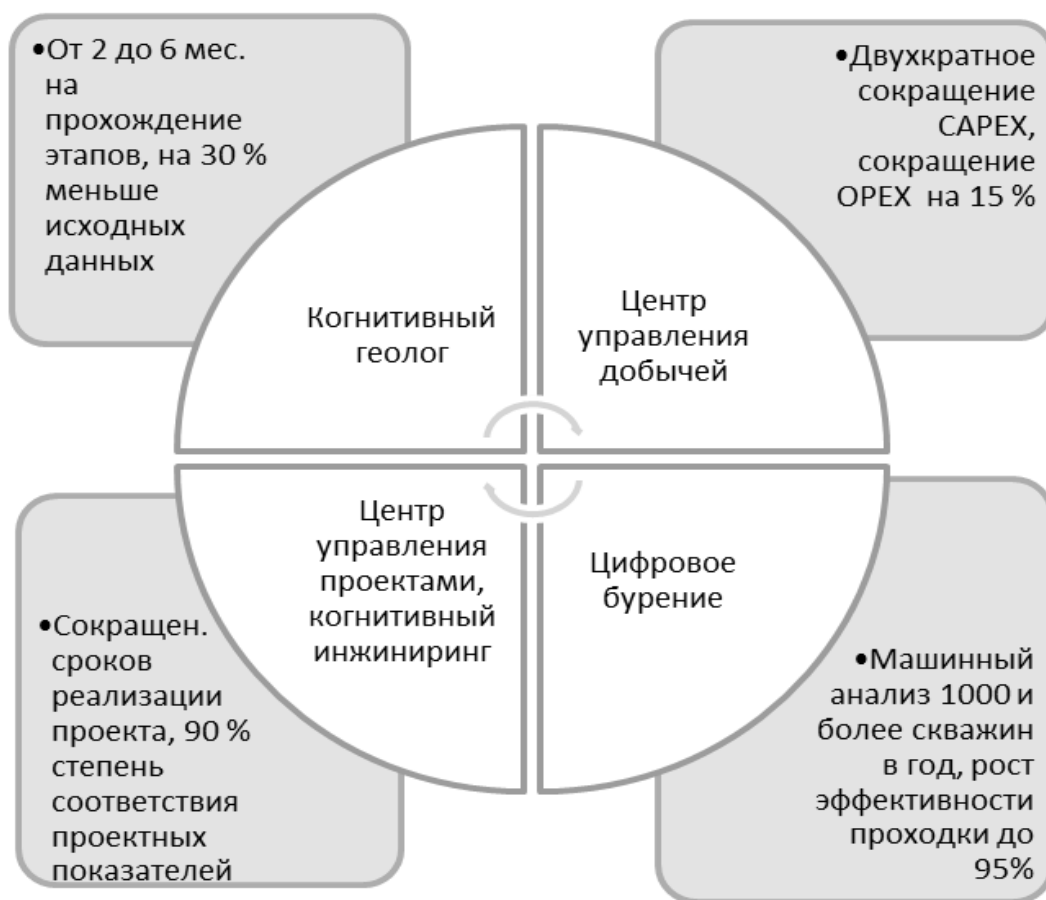
Рисунок 1 – Перспективные направления и эффективность использования цифровых технологий в нефтегазовой отрасли [2]

Как известно нефтеизвлечению предшествует целый комплекс услуг – нефтесервис. Это разведка, бурение, нефтепромысловое обустройство месторождений, поддержание и увеличение нефтеизвлечения, демонтажные работы. Такие услуги составляют значительную часть капиталовложений. Следовательно, нужно развивать рынок нефтесервисных услуг. В настоящее время в России нефтесервисные компании либо самостоятельные, либо аффилированные с ВИНК, что позволяет им быть более финансово обеспеченными, в том числе и в целях использования цифровых разработок (рисунок 1).