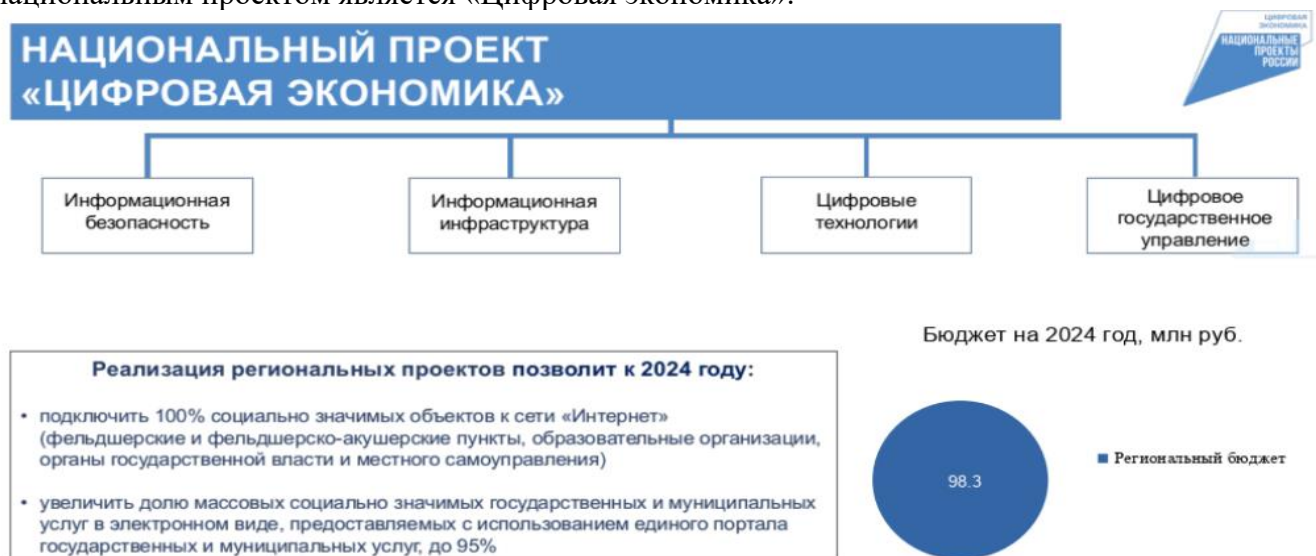
Рисунок 3 – Развитие национального проекта «Цифровая экономика» [4].

Цифровизация управления открывает новые перспективы для повышения эффективности. Геоинформационные системы (ГИС), внедряемые в рамках программы «Умный город», используются для эффективной системы управления городским хозяйством, а также важным национальным проектом является «Цифровая экономика».