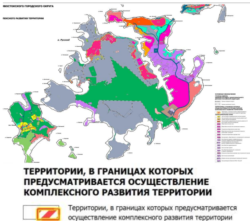
Рисунок 2 – Территории, в которых предусматривается осуществление КРТ в городе Владивосток [3].

Правила землепользования и застройки города Владивостока, детализируют функциональное зонирование прибрежных территорий.