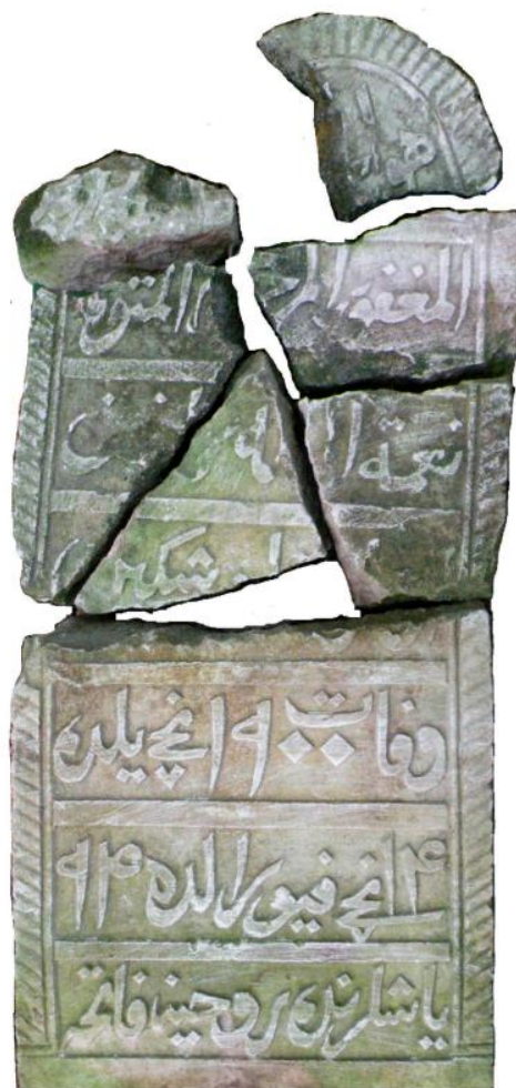
Эпиграфический памятник Нигматуллы бин Рафика, 1900 г.