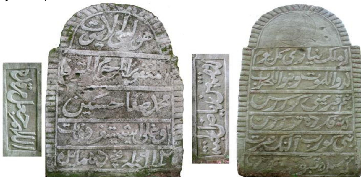
Эпиграфический памятник Мухаммедсафы бин Хусаина, 1912 г.

Надписи имеются на всех четырех сторонах стеллы. На лицевой стороне в тимпане вырезан полумесяц с пятиконечной звездой.