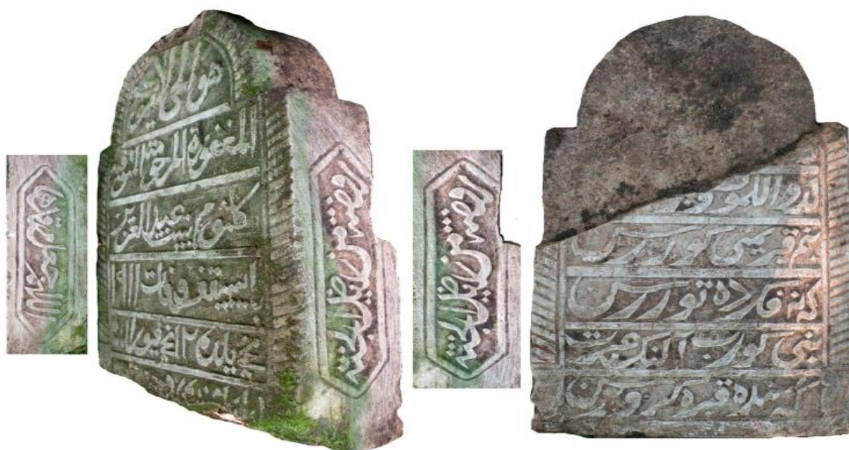
Эпиграфический памятник Гульсум, дочери Абдулазиза, 1911 г.

Нижняя часть камня отсутствует. Надписи имеются на всех четырех сторонах стеллы. На оборотной стороне отслоенная верхняя часть памятника при разрушении (наискосок) не сохранился, видимо был погребен слоем земли.