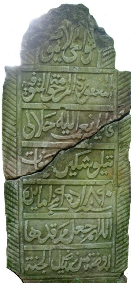
Эпиграфический памятник Фатыймы, супруги Нигматуллы, 1890 г.

В навершии имеются частичные разрушения, по середине наискосок стелла разбита на две половины.