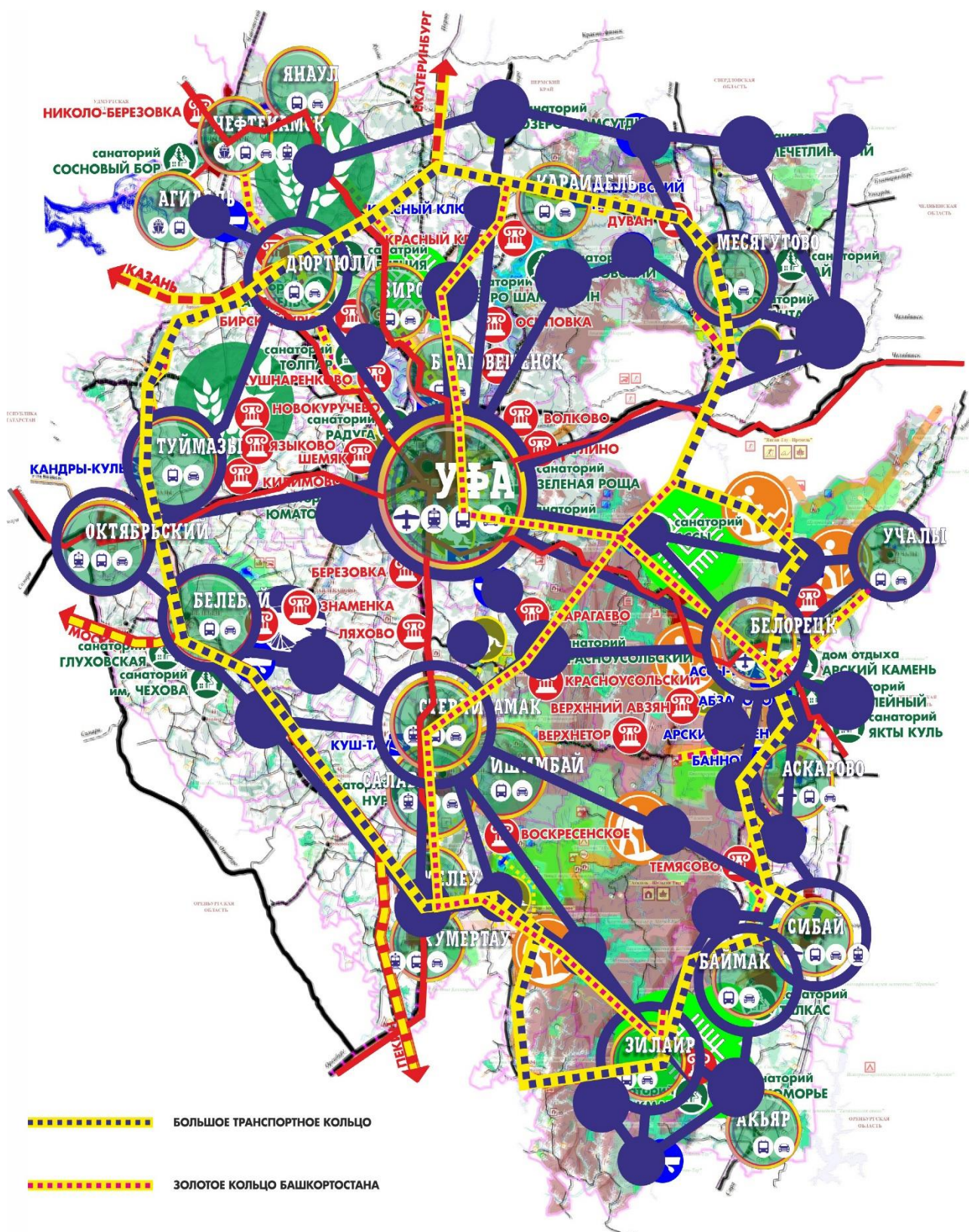
Рис.2 Концепция региональной организации связей между субъектами услуг туризма.