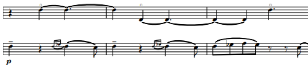
Рис. 6 «Шесть мгновений счастья или сны Золушки». Третья часть

Третья часть состоит из трех тематических комплексов. Предваряет всю часть вступление из нисходящих движений в партии мандолины и балалайки, как связующее звено предыдущего раздела. Первая и третья (репризная) написаны в стилистике медленного старинного танца, имеет переменный размер, 4+3/8 , что создает оживленный характер. Главная тема (Рис. 6) данных разделов звучит попеременно у мандолины и балалайки: