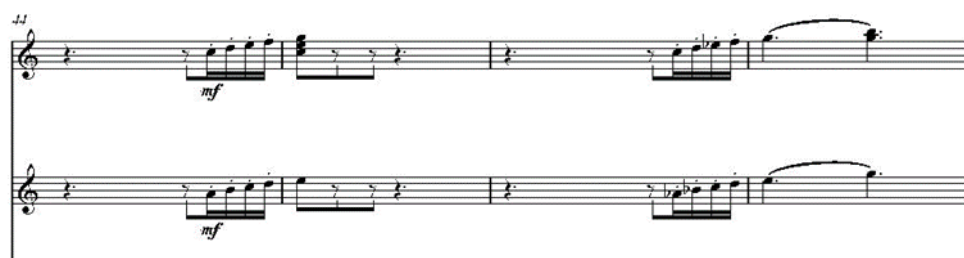
Рис. 12 «Шесть мгновений счастья или сны Золушки». Пятая часть

Использованы и восходящие пассажи из шестнадцатых во время звучания темы у камерного оркестра (Рис. 12):