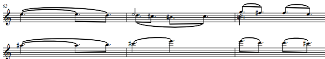
Рис. 10 «Шесть мгновений счастья или сны Золушки». Четвертая часть

продемонстрирована композитором в форме диалога балалайки и мандолины, когда инструменты «разговаривают» короткими мелодическими построениями, отвечая друг другу, развивая беседу в кульминацию Четвертой части, где мандолина и балалайка сплелись в единое звучание: