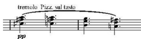
Рис. 5 «Шесть мгновений счастья или сны Золушки». Вторая часть

Михаил Броннер использует в представленной части некоторые специфические приемы игры на мандолине и звучания оркестра. Например, чтобы предать мистичность вступлению, он использует тремоло пиццикато указательным пальцем правой руки (Рис. 5), благодаря чему мандолина звучит приглушенно и таинственно: