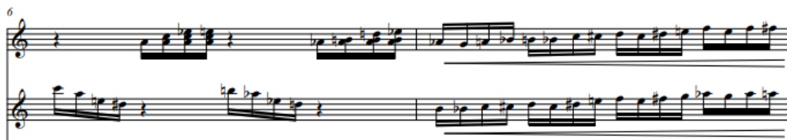
Рис. 13 «Шесть мгновений счастья или сны Золушки». Шестая часть

Шестая часть, заключительная, является наиболее драматичной. С первых нот звучит напряжение. У мандолины и балалайки звучат непрерывные шестнадцатые, в нисходящем движении у мандолины, в восходящем – у балалайки (Рис. 13):