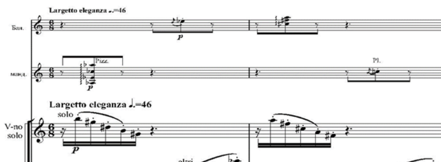
Рис. 2 «Шесть мгновений счастья или сны Золушки». Первая часть

Характер этой части можно охарактеризовать как легкий, изящный. При прослушивании данного музыкального отрывка возникает образ самой Золушки, такой же хрупкой, утонченной, живой. Стоит отметить, что автор не утяжеляет партитуру, камерный оркестр звучит прозрачно, создавая легкое мерцание нисходящих и восходящих пассажей. На такое звучание накладывается диалог мандолины и балалайки (Рис. 2), изложенный одиночными аккордами на пиццикато и нотой, исполненной медиатором: