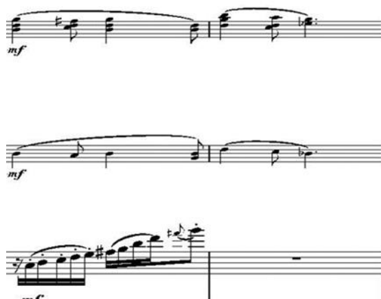
Рис.1 «Шесть мгновений счастья или сны Золушки». Первая часть

Характер этой части можно охарактеризовать как легкий, изящный. При прослушивании данного музыкального отрывка возникает образ самой Золушки, такой же хрупкой, утонченной, живой. Стоит отметить, что автор не утяжеляет партитуру, камерный оркестр звучит прозрачно, создавая легкое мерцание нисходящих и восходящих пассажей. На такое звучание накладывается диалог мандолины и балалайки (Рис. 2), изложенный одиночными аккордами на пиццикато и нотой, исполненной медиатором: