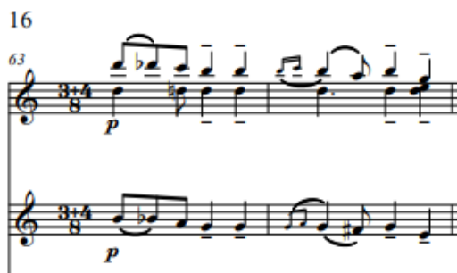
Рис. 7 «Шесть мгновений счастья или сны Золушки». Третья часть

Второй раздел Третьей части представляет веселый, задорный, быстрый танец с переменным размером и «притопом» на последнюю ноту в квадрате музыкального построения (Рис. 7). Здесь размер меняется с пятидольного на шестидольный. Звучит Тутти у всего оркестра с сопоставлением солистов оркестру: