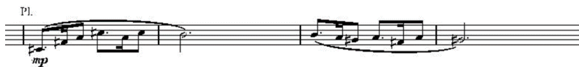
Рис. 3 «Шесть мгновений счастья или сны Золушки». Вторая часть

Во всей части можно выделить три темы, две из которых довольно похожи, отличаются лирическим характером, представляют построение из восьми тактов. Мелодия построена на пунктирном ритме, имеет восходящее движение. Данная тема (Рис. 3) отражает задумчиво-романтический характер Золушки и исполняется приемом игры тремоло: