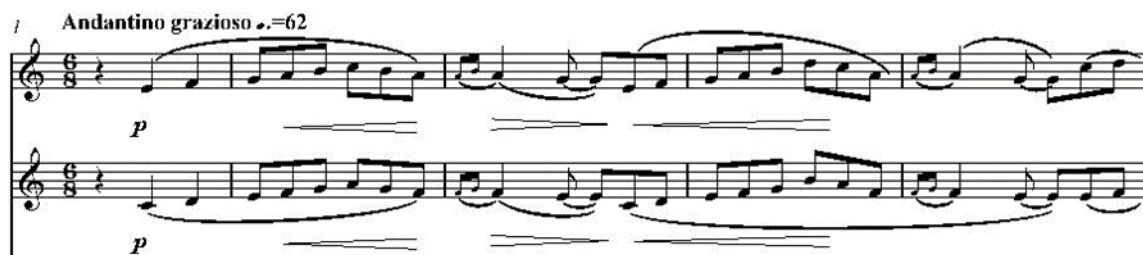
Рис. 11 «Шесть мгновений счастья или сны Золушки». Пятая часть

Следующая Пятая часть Цикла продолжает романтическое и воодушевленное настроение предыдущей части. Мандолина и балалайка продолжают «кружить» в том же трехдольном вальсовом ритме, то подхватывая друг друга, то звуча двухголосием, иллюстрируя главных героев. Композитор применил в данном разделе тремоло легато для передачи нежного образа Золушки, сливающимся с тембром балалайки (Рис. 11):