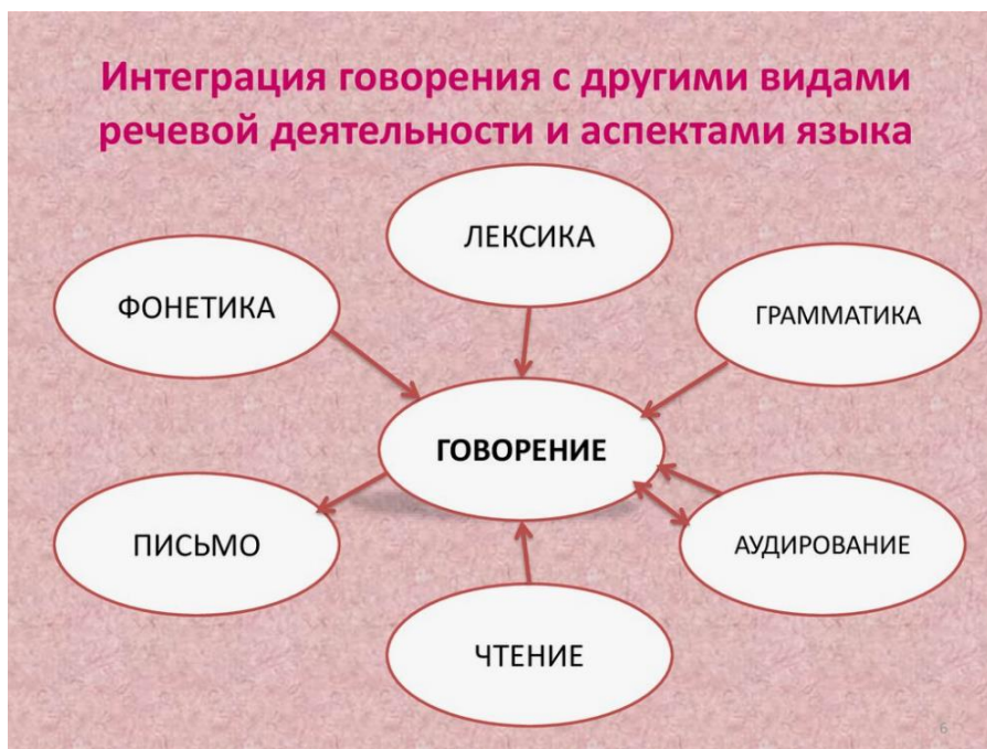
Рисунок 1 – Интеграция говорения с другими вида речевых проявлений [11]

В гражданской авиации АЯ является единственным рабочим языком, который используется для ведения переговоров на международных воздушных путях. Если в прошлые времена ЧКЭВС должны были владеть стандартными фразами, то сейчас обучение летного состава требует получения полного спектра КК. Так как недопонимания между летчиками и ЧКЭВС приведет к опасным последствиям. Ошибки в говорении подрывают безопасность полета в следующих случаях: