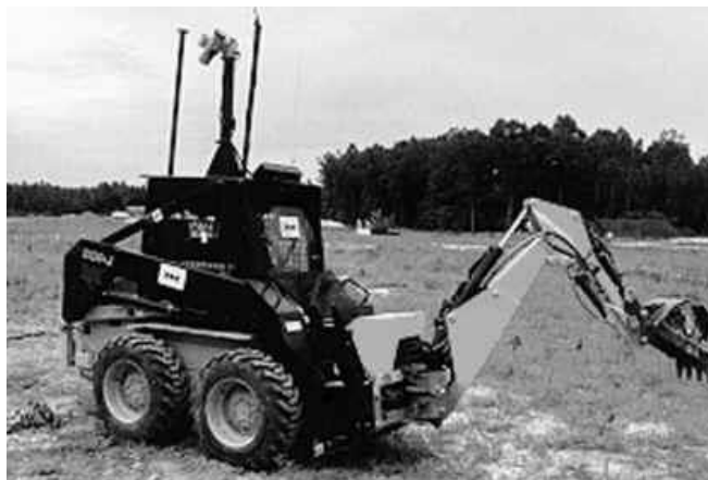
Рис. 3. Транспортное средство роботизированной системы разминирования ETODS (ОАО, США) выполнено на базе погрузчика типа Bobcat

Конструктивно универсальные мобильные роботы представляют собой малогабаритные самоходные средства, оснащаемые разведывательной аппаратурой, набором сменного рабочего оборудования и инструмента. Они рассчитаны на дистанционное управление оператором, ведущим наблюдение непосредственно или с помощью телевизионной камеры. В состав установленных на роботах комплексов приборов и оборудования входят: