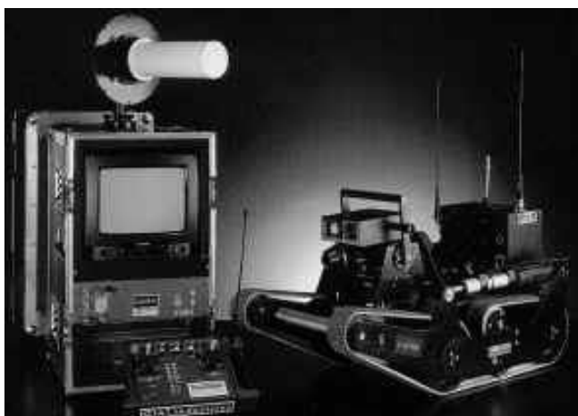
Рис. 4. Мобильный робот Castor (GIAT Industries, Франция) может иметь либо колесную, либо гусеничную ходовую часть

МРВК состоит из одного или нескольких мобильных роботов, комплекта сменного рабочего оборудования, средств доставки, энергообеспечения и технического обслуживания (см. рис. 5).