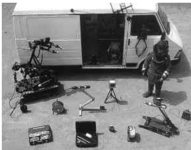
Рис. 5. Мобильный роботизированный взрывотехнический комплекс, состоящий на вооружении специальных подразделений Министерства обороны Франции. В состав комплекса входят мобильный робот Wheelbarrow Mk8+ и мини-робот Cyclops Mk4, а также комплект специального снаряжения (разрушители различной мощности, инструмент и приспособления), применяемого с помощью роботов

Ядром комплекса является универсальный мобильный робот (массой от 200 до 400 кг), оснащаемый рабочим оборудованием и инструментом, обеспечивающим: