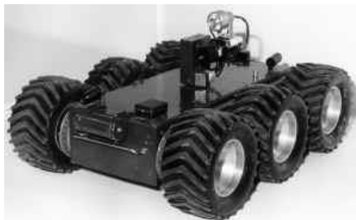
Рис. 1. Сверхлегкий мобильный робот МРК-01 (МГТУ им. Н. Э. Баумана).

Предназначен для проведения инспекционных проверок, поиска и уничтожения взрывоопасных предметов. Является базовым образцом для семейства малогабаритных роботов.